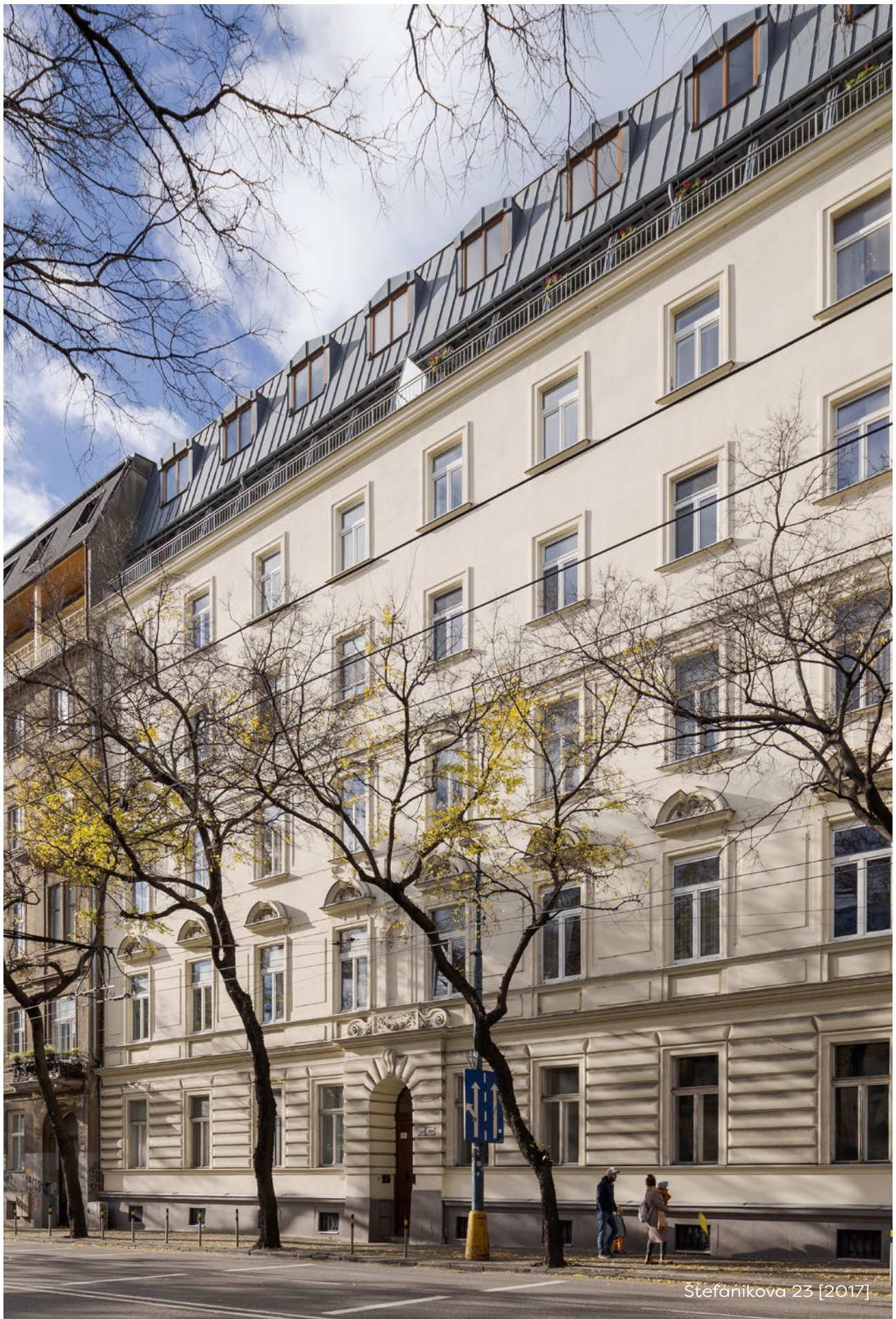
Štefánikova 23 [2017]