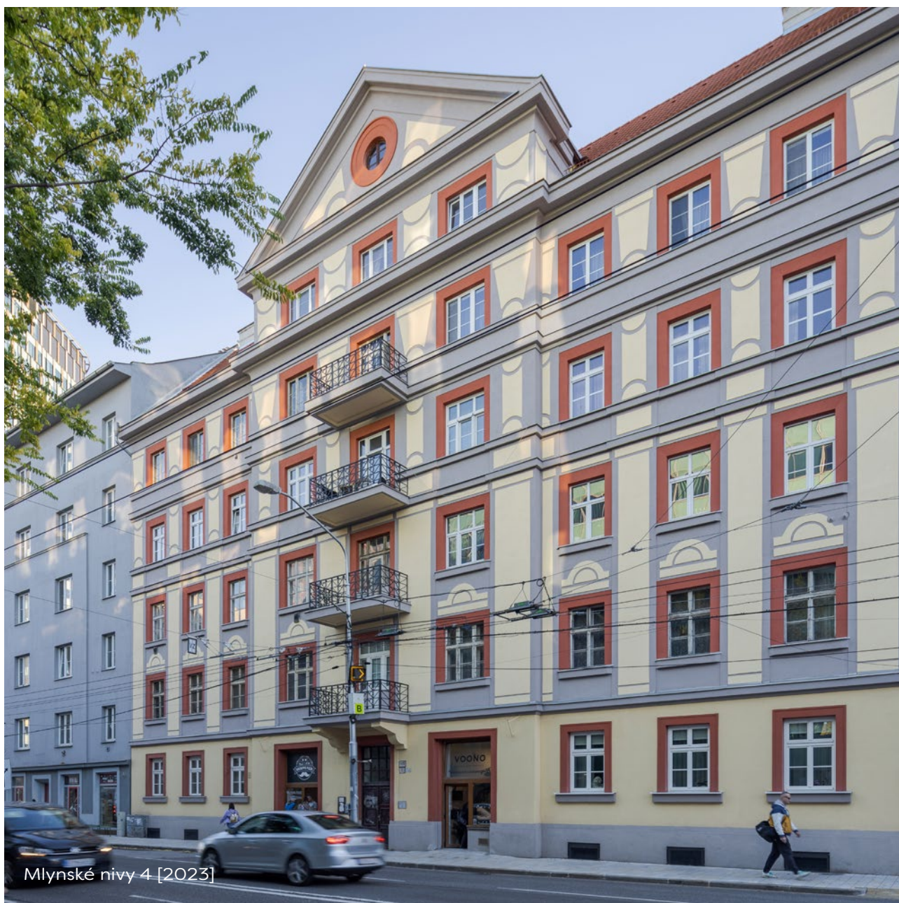
Mlynské nivy 4 [2023]

Dlhoročné skúsenosti v segmente obnovy budov nás prirodzeným spôsobom posunuli aj do oblasti rekonštrukcie historických objektov a národných kultúrnych pamiatok. Pustiť sa do rekonštrukcie národnej kultúrnej pamiatky či nehnuteľnosti situovanej v pamiatkovej rezervácii, pamiatkovej zóne alebo v ochrannom pásme si vyžaduje znalosť právnych predpisov, odbornú spôsobilosť a skúsenosti v tejto oblasti.