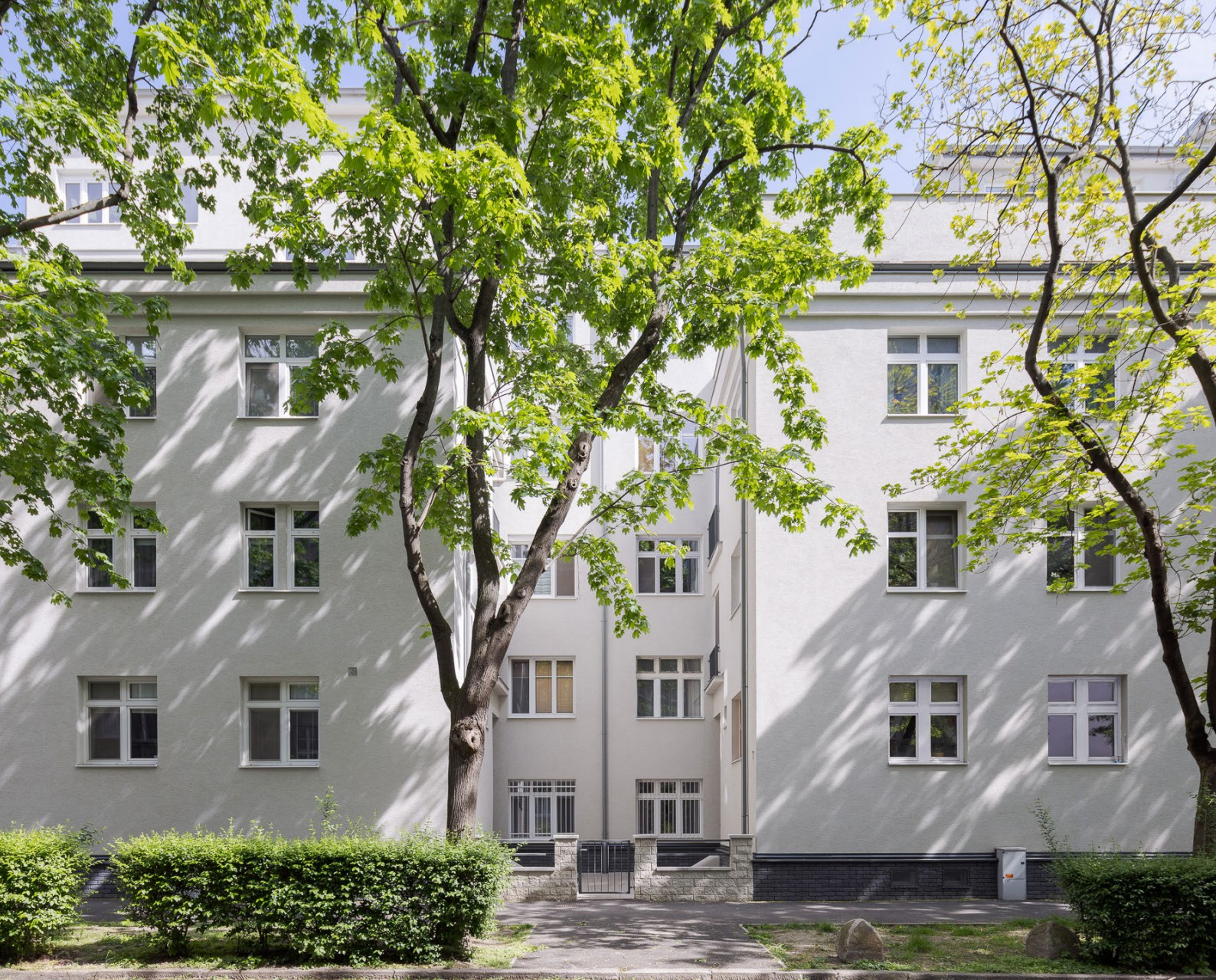
Pri starej prachárni 5-9 [2022]

Roky skúseností nás naučili počúvať vaše požiadavky, premýšľať o vašich potrebách a následne ich spracúvať do funkčných a efektívnych riešení.